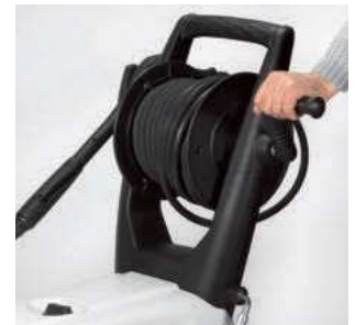
Praktisches Detail: Die Schlauchhaspel

Serienmäßiges Standardzubehör für KW 900 Zweiteilige Lanze mit Variodüse und Pistole, 10 m Hochdruckschlauch, Elektrokabel mit CEE-Stecker, Injektor und Reinigungsmitteltank