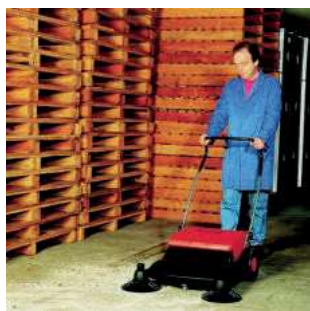
Zeitsparende Reinigung im Lagerbereich

Die Wilms HKM 800 ist immer startklar. Einfach losfahren und schon kehrt sie. Dies fast zehnmals schneller als mit dem Besen. Die Schmutzaufnahme erfolgt selbsttätig in einen großen Kunststoffbehälter. Dank Doppelwalzen-System mit zwei Walzenbürsten sammelt sie Staub, Holzabfälle, Nägel, Styropor, Laub, Papier, kleine Steine und sogar Getränkedosen und Becher systematisch auf. Die Wilms HKM 800 ist völlig wartungsfrei, leicht zu handhaben.